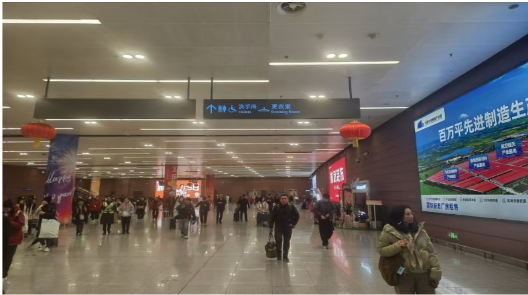
(进港大厅更衣室导向标识 7 个)