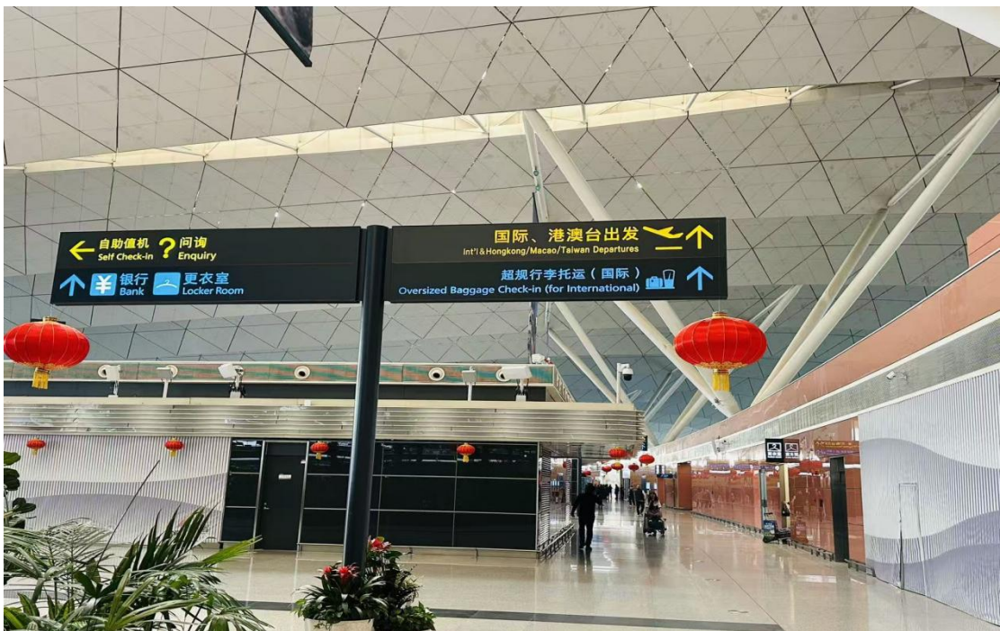
(出港大厅更衣室导向标识 15 个)